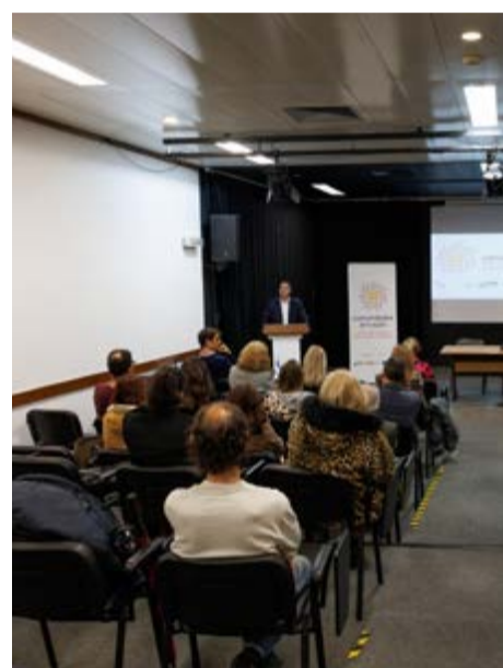
Apresentação do projeto