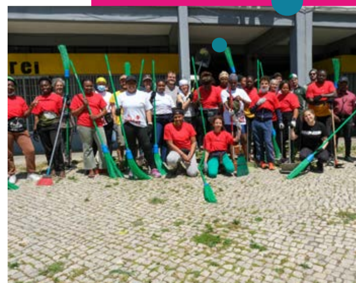
Espaço Polidesportivo do Monte da Caparica

A Câmara Municipal de Almada convida todos os moradores a participar ativamente na escolha das intervenções prioritárias. Esta é a oportunidade para decidir o futuro dos espaços comunitários e ajudar a construir um bairro mais acolhedor e moderno.