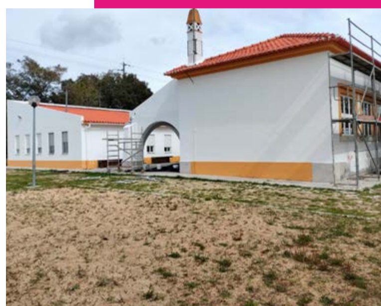
Centro comunitário de S. Pedro

pintura exterior e interior; cobertura, paredes e arranjos exteriores. O espaço desempenha um papel importante na melhoria do apoio à infância e de inclusão social.