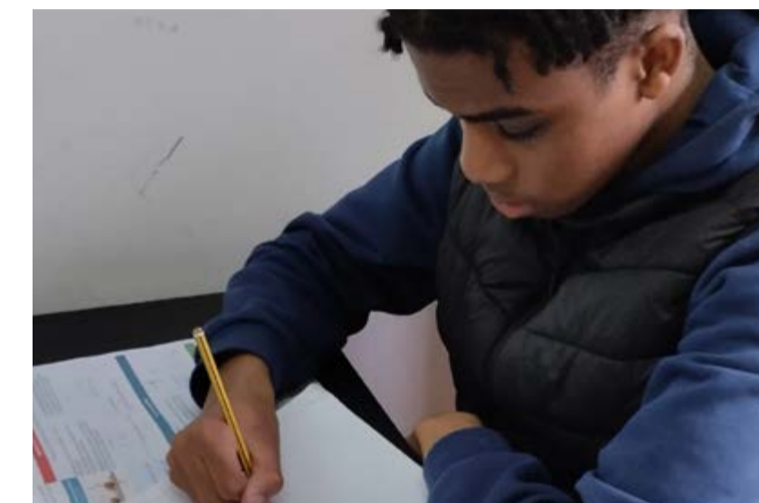
Aluno inserido no projeto Avançar e Recuperar

O "Laboratório/Oficina de Inovação" centra-se no desenvolvimento de competências escolares, técnicas e digitais, através de atividades que promovem a aprendizagem ativa e a interação. Este projeto visa capacitar os jovens com habilidades essenciais para o século XXI, facilitando a sua inserção no mercado de trabalho. Além disso, será promovido o envolvimento das famílias, essencial para o sucesso do projeto, através de reuniões periódicas para acompanhamento e corresponsabilização no processo educativo. A Operação Integrada Local é um instrumento que visa não apenas melhorar os resultados de aprendizagem, mas também fomentar a inclusão social, contribuindo para a Estratégia Nacional de Combate à Pobreza 2021-2030 e para os Objetivos de Desenvolvimento Sustentável da Agenda 2030.