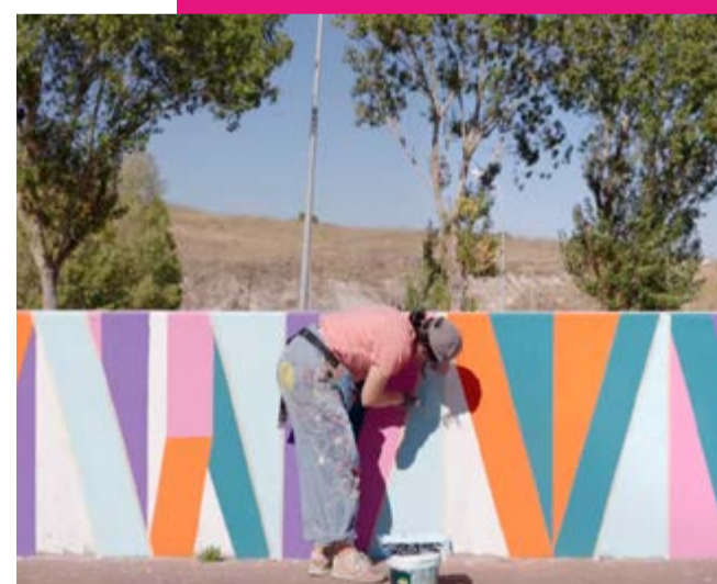
Bairro do Casal da Boba

EGZIT e a AQK - Associação Quorum Cultural, que têm promovido diversas atividades com a comunidade local, reforçando o papel da cultura como motor de inclusão social.