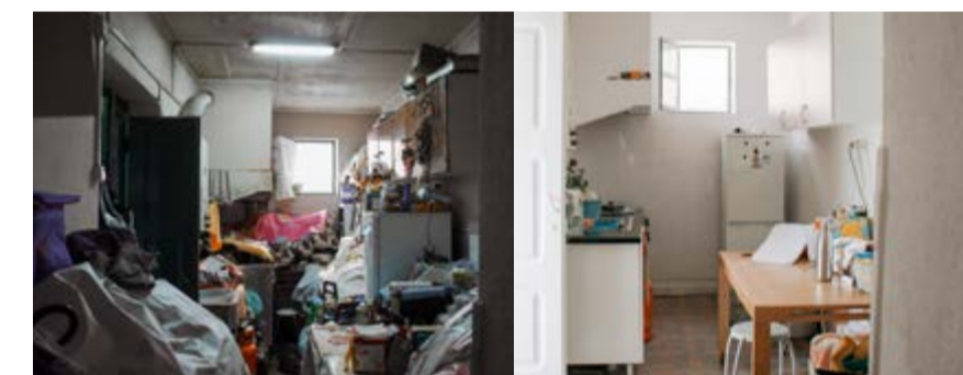
Antes e depois de uma intervenção

Com o apoio das Juntas de Freguesia e entidades sociais locais, o projeto mobiliza voluntários e recursos para realizar intervenções essenciais, como reparação de telhados, janelas, canalização, revisão elétrica e pintura, proporcionando conforto, salubridade e eficiência energética às habitações. Ações principais: