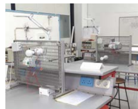
Oficinas de capacitação

lação se adapte às exigências da era digital. Estas iniciativas refletem o compromisso da Câmara Municipal em proporcionar ferramentas e oportunidades que promovam o desenvolvimento profissional e a inclusão social.