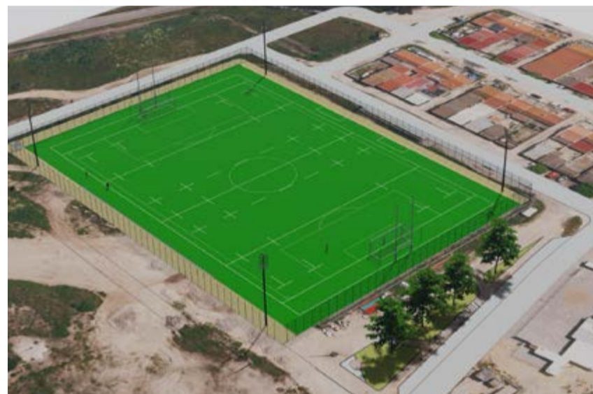
3D do campo de futebol do Passil

nómicas, visíveis no desenvolvimento inequívoco do desporto de competição, associativo, de lazer e de apoio a escolas e outras instituições. Atualmente existe um campo de futebol de 11 com piso em saibro e um pequeno edifício de apoio que consiste numa intervenção formalmente descaracterizada e sem condições funcionais para responder às necessidades contemporâneas. A Fase 1 tem quatro elementos de trabalho: estaleiro, muro, vedação, campo e iluminação do campo. No interior do recinto proceder-se-á à colocação de relva sintética, especialmente indicada para pisos desportivos para várias modalidades, sendo flexível, durável, de fácil aplicação e manutenção. A iluminação do campo de futebol de 11 de Passil será realizada através da instalação de 4 colunas metálicas de 18 metros, equipadas cada uma com