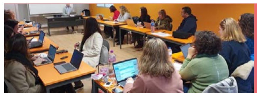
Formação em gestão de projetos

O sucesso da gestão de projetos, baseado numa abordagem sistémica e flexível, foi um dos principais temas em destaque. No final, os formandos apresentaram projetos concretos desenvolvidos pela Câmara de Loures, incluindo iniciativas ligadas à candidatura do Município ao projeto Comunidades Desfavorecidas.