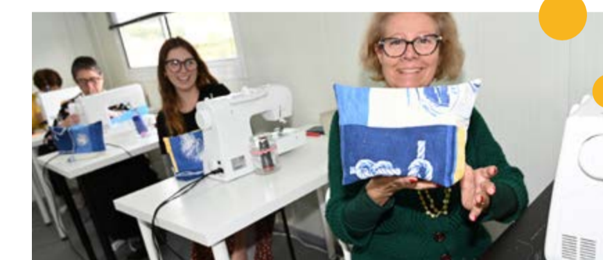
Atelier de costura artística, etnográfica e multicultural

Este projeto empodera os participantes, ligando-os à sua identidade cultural e à comunidade, tornando-se um espaço de criatividade e solidariedade.