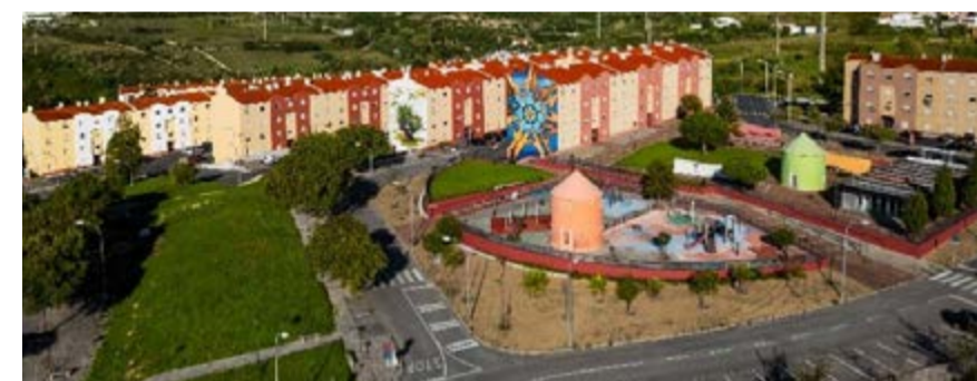
Espaço público Bairro dos Navegadores

- A requalificação física do espaço público ou de infraestruturas sociais, de saúde, de habitação ou desportivas; - Eliminar situações de exclusão social, com soluções de combate à pobreza e exclusão social; - Desenvolver atividades que contribuam para o processo de coesão social a nível local, através da promoção do desporto enquanto um dos instrumentos sociais agregadores dos membros da comunidade, que promove valores e combate das desigualdades sociais.