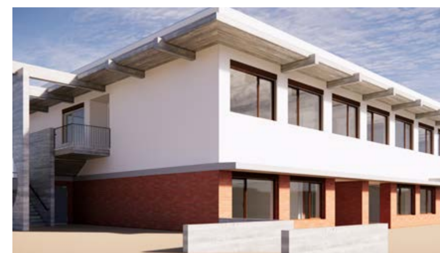
3D do novo centro escolar Barbosa do Bocage

A EB Barbosa do Bocage mantém-se em funcionamento com os 2º e 3º ciclos, em recinto ampliado em mais 4800 metros quadrados para receber as novas valências de pré-escolar e 1º ciclo.