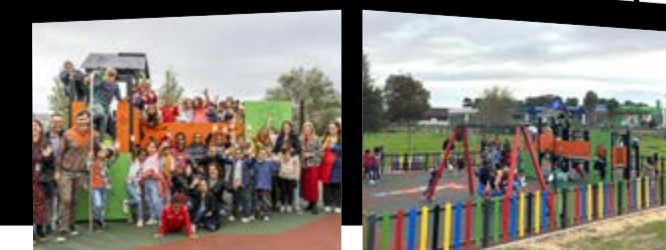
Parque Infantil do Casal do Marco

Um parque que simboliza um investimento no futuro