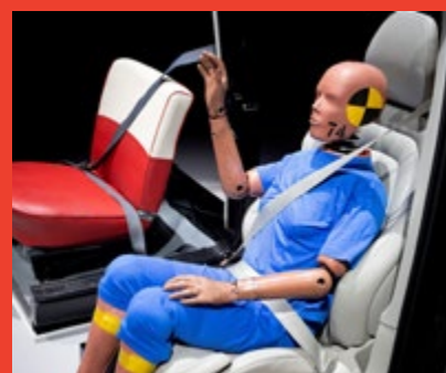
Volvo Cars Moment – Safety Live Images

Num reforço do compromisso para com a segurança automóvel, a marca sueca Volvo Cars lançou a iniciativa Equal Vehicles for All [E.V.A., veículos iguais para todos/as]], que partiu do reconhecimento de que a indústria automóvel produzia carros baseados exclusivamente em dados de manequins masculinos. Ao abrigo desta iniciativa, a marca decidiu tornar públicos os dados de sinistralidade rodoviária recolhidos desde a década de 1970 pela sua equipa de investigação de acidentes, que lhe tem permitido tornar os seus automóveis mais seguros. Assim, também as marcas concorrentes terão acesso aos dados, o que poderá potencialmente melhorar a segurança de todos os automóveis para todas as pessoas (adultas e crianças) e não apenas para o “homem padrão”.