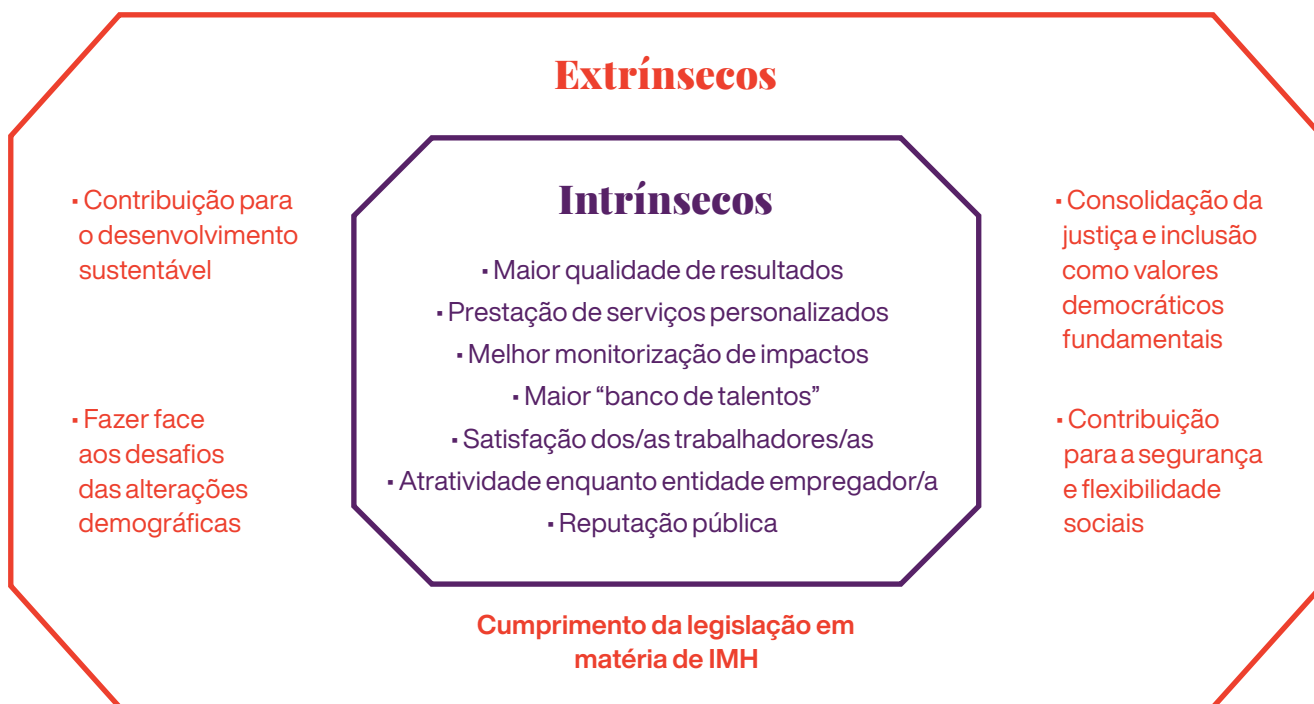
Figura 1 – Benefícios intrínsecos e extrínsecos da igualdade de género

A promoção da IMH de forma sistemática e direcionada pode comportar benefícios de natureza extrínseca e intrínseca, como proposto pelo Instituto Europeu para a Igualdade de Género (EIGE, 2016). Por motivações extrínsecas entendem-se as relacionadas com uma dimensão mais macro, societal, enquanto as intrínsecas se prendem com a relação entre a implementação de uma estratégia de MG e os benefícios que daí podem advir para as organizações. A figura seguinte ilustra os dois tipos de motivações (V. Figura 1 ).